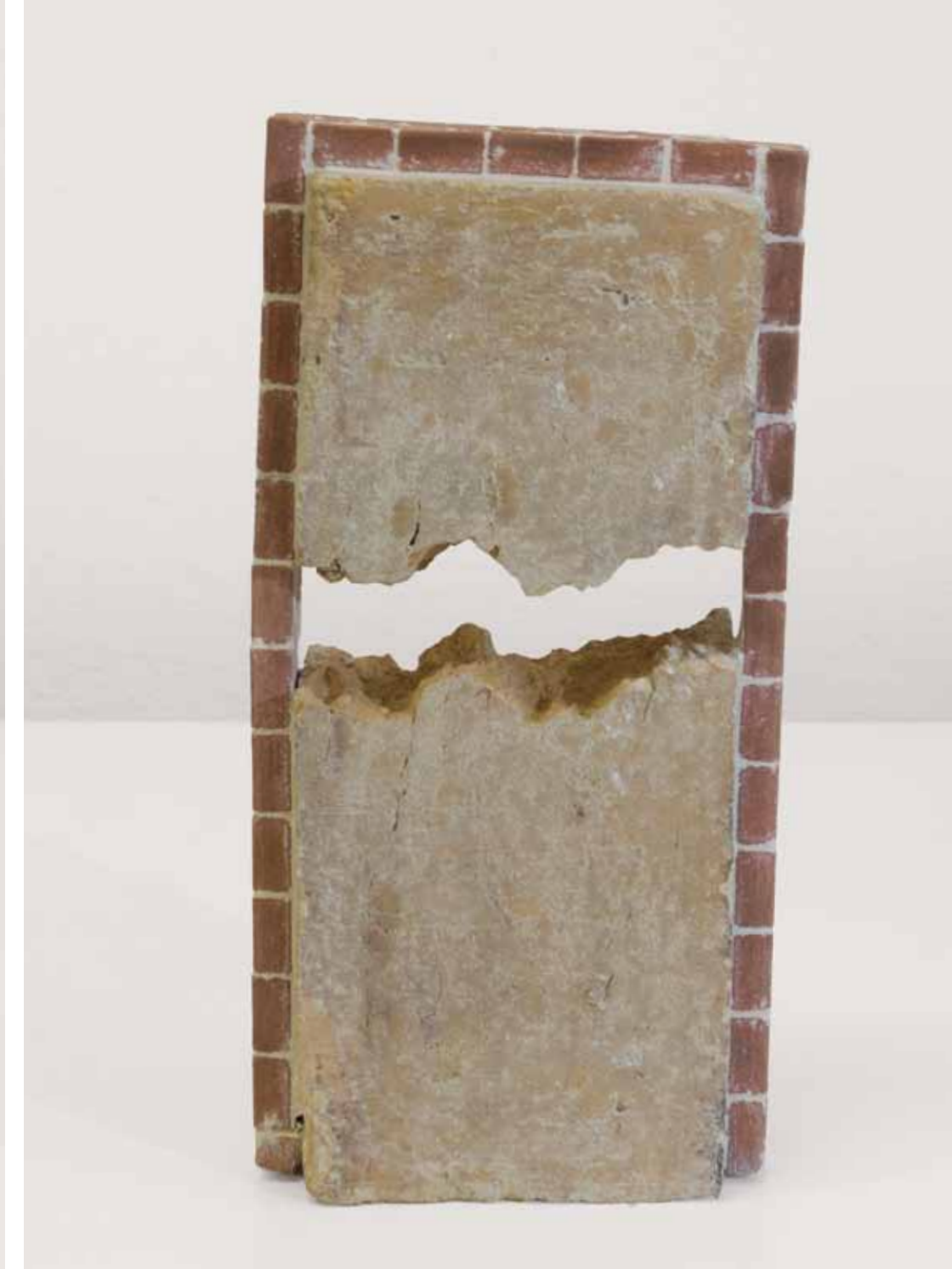
FAKE TOWER 9