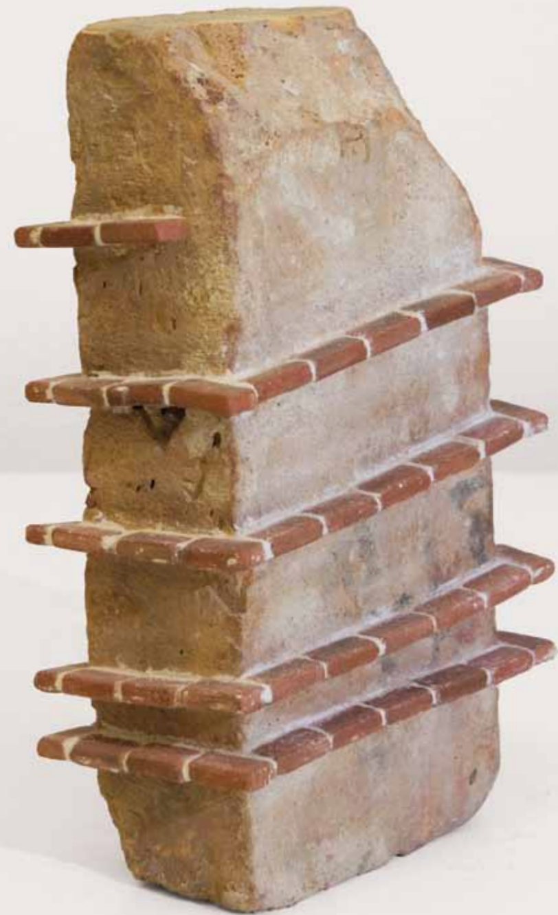
FAKE TOWER 7