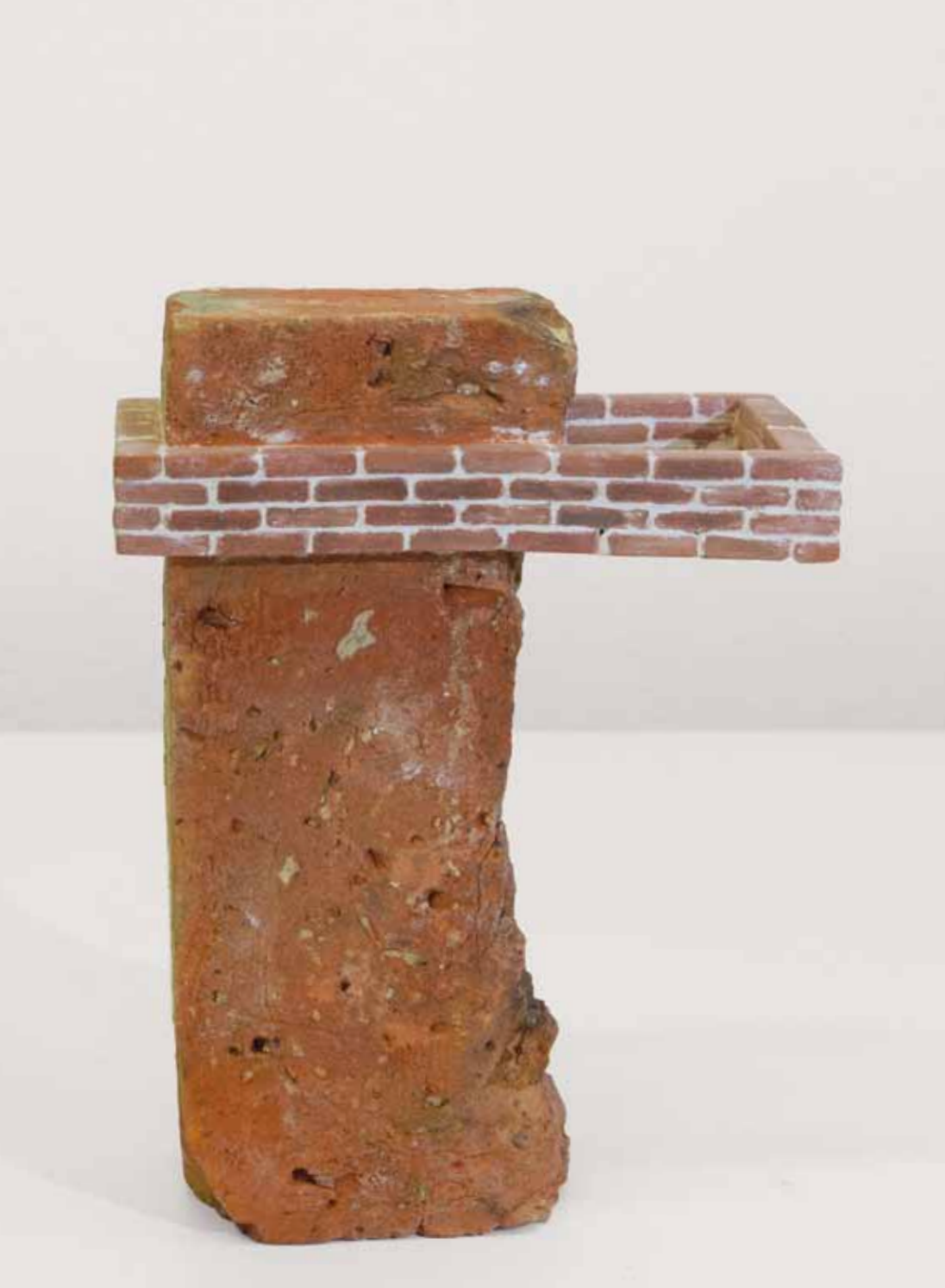
FAKE TOWER 11