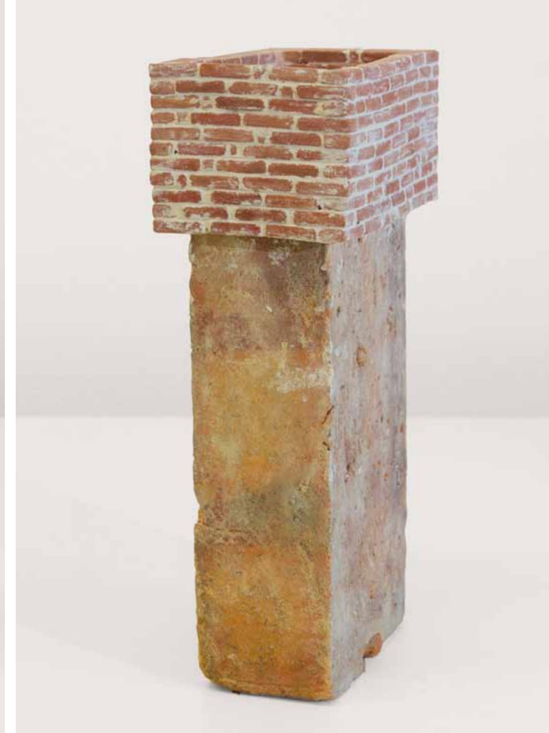
FAKE TOWER 10