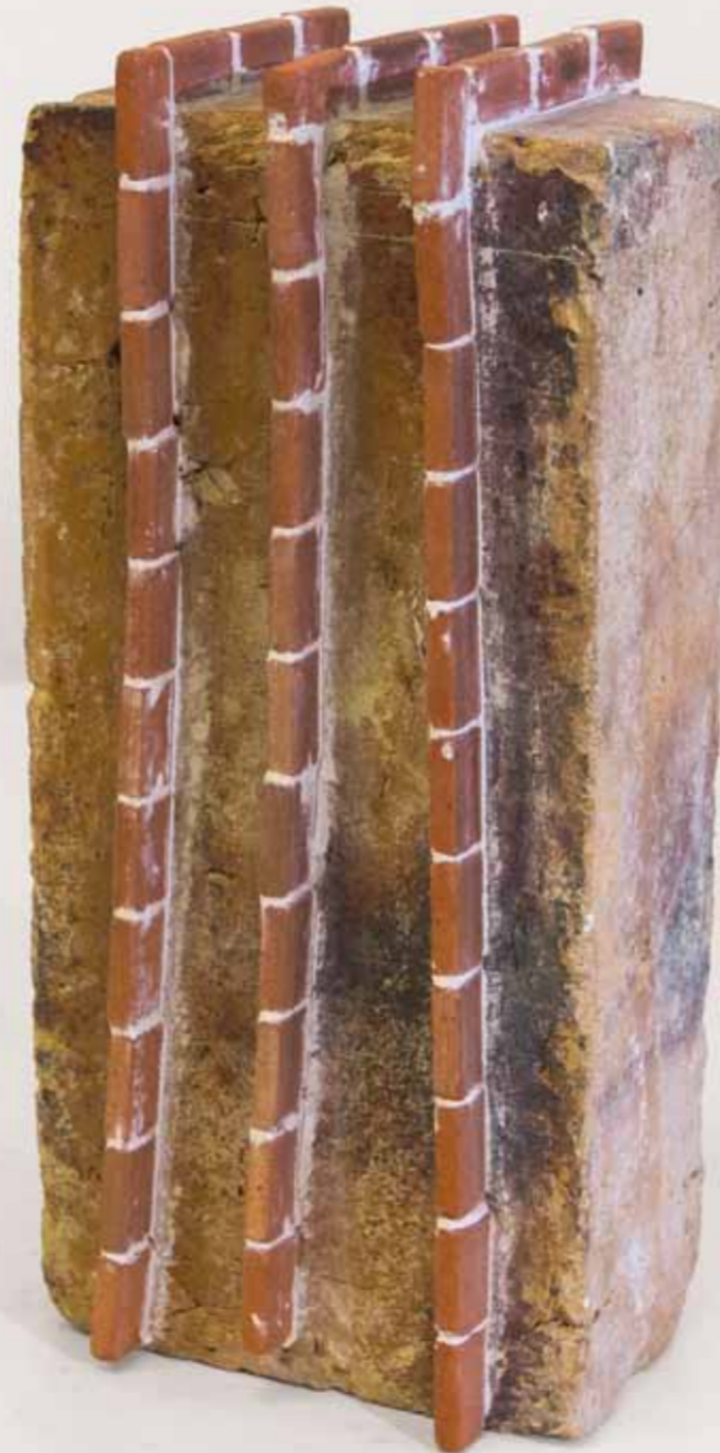
FAKE TOWER 8