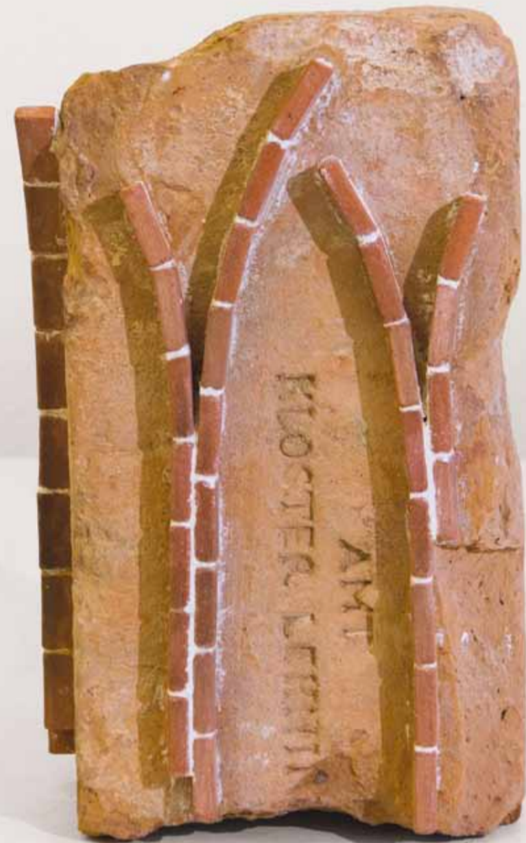
FAKE TOWER 2