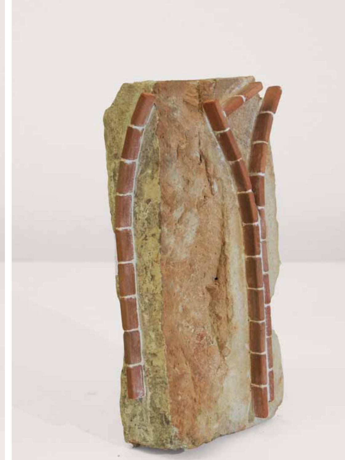
FAKE TOWER 6