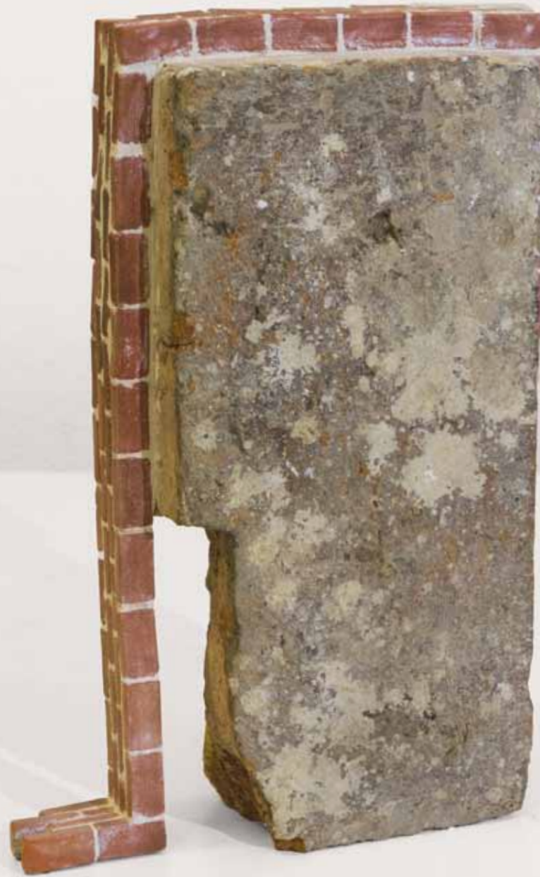
FAKE TOWER 5